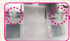
ウォーターサーバーの注ぎ口(例)