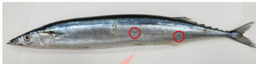
【さんまのウロコの画像】

さんまのウロコは非常にはがれやすく、漁獲する際にほとんど摩擦ではがれてしまいます。しかし、表面に残っていたり、はがれたウロコがさんまの口から入り、おなかの中から発見されたりすることもあります。